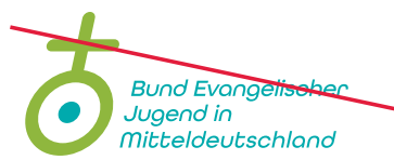
Neigen oder Verzerren