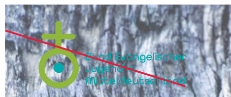
Wiedergabe auf Hintergründen mit zu geringem Kontrast zum Logo.