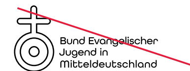
Darstellung als Kontur